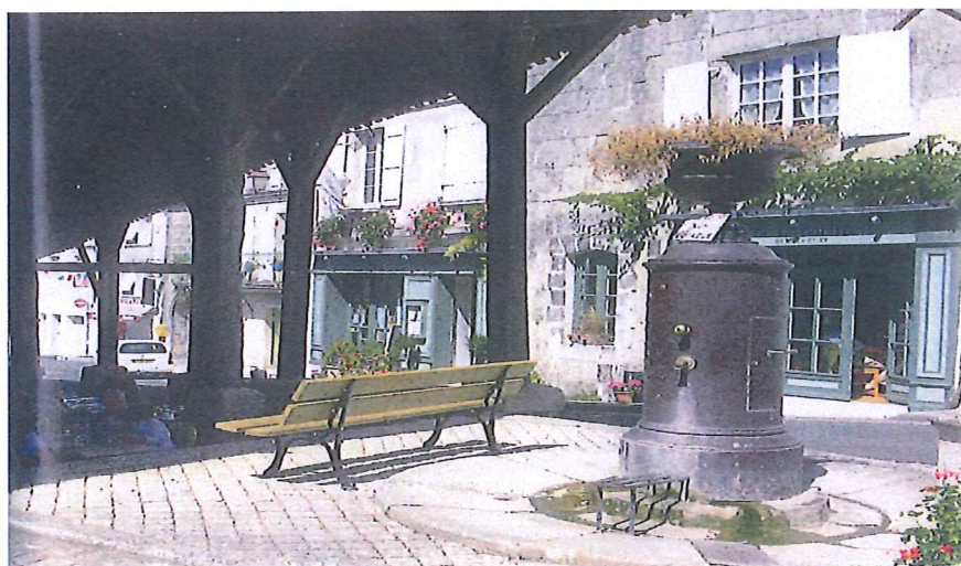
Place des Halles.

Un chemin longe, au pied de la muraille, le contour de l'enceinte jalonnée de sept tours rondes. L'une des tours ouest a été reconstituée et recouverte en 2013. L'accès au château se fait par une porte du 14 e s., découronnée, qui possède encore les rainures de son pont-levis. Une importante salle basse du 12 e s., autrefois voûtée, longue de plus de 30 m, a été découverte et dégagée. La chapelle, construite sur deux niveaux (12 e et 13 e s.), a retrouvé une haute toiture de tuiles plates et sa charpente a été reconstituée. Les pèlerins en route pour Compostelle trouvaient refuge dans la chapelle basse. Le logis du château fut reconstruit au 17 e s., englobant le bâti du 12 e et du 14 e s., par le duc de Navailles, exilé sur ses terres par Louis XIV. Il présentait un plan en « U », mais un incendie au 19 e s. n'a laissé subsister que l'aile ouest, où l'on voit encore une belle fenêtre gothique, et une partie du bâtiment sud.